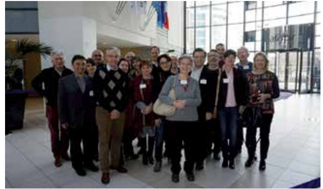
PARIS - AFNOR - Janvier 2016 - Les participants

Ce résultat positif est un grand pas en avant pour la reconnaissance de l'homéopathie médicale dans toute l'Europe. Il était d'ailleurs