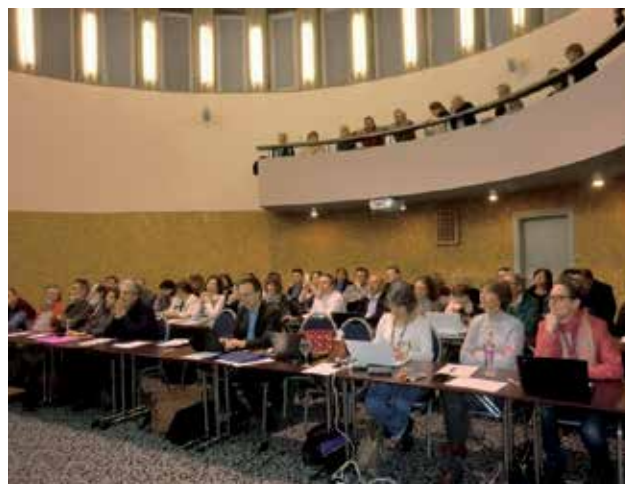
Atelier de travail ECH - Vilnius - L'audience